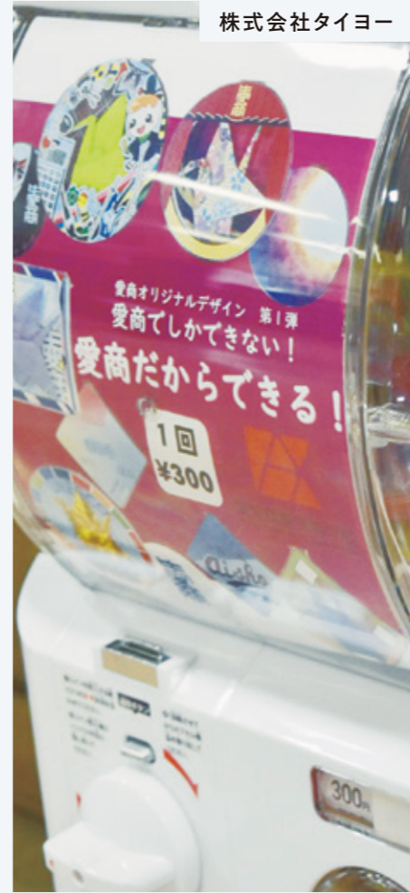
株式会社タイヨー