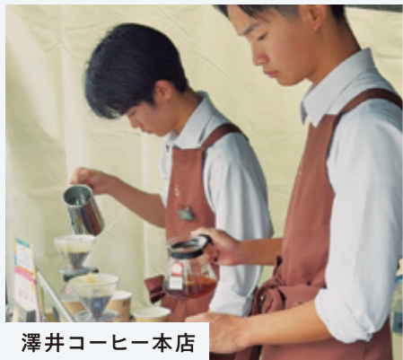
澤井コーヒー本店